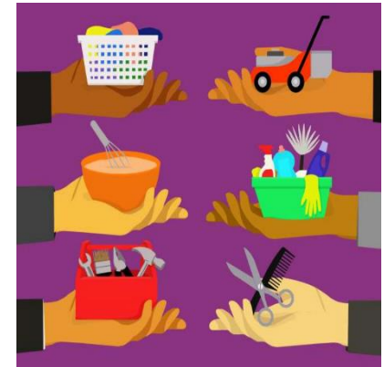
Permutas Troca de Serviços